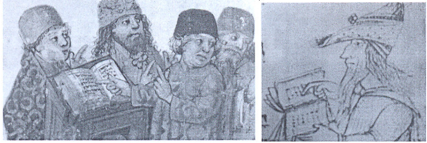
יהודים בעלי שערות ארוכות, מתוך איורים בכתבי יד

ובלורית / והם בעלי ברית / לשעירים אשר הם זונים אחריהם. ואולי אחר הם יעופו 24 / בשערותם אשר עדפו / ילכו ולא ייעפו... ואולי נשברו גדל המספּרִים והתער / או האומנים אחזו סער, על כן יער שערם גדל וסוער / וחיתו אין די בער. וכי ירים כיניו 25 , לאחוז בסבך בקרניו; והנה השורים